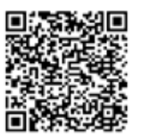
QR kód trasy

Vyjedte od hotelu Atlas nebo Benica jihovýchodním směrem po červené turistické trase. Ve Skalci sjeďte ze silnice doleva, stále sledujte červené turistické značení. Přes Budkov se přehoupnete do Pecínova. Od něj budete stoupat na Pozov. Vyplátí se, pak vás čekají méně náročné cesty kolem osady Mokliny až do Roubíčkovy Lhoty a Lísku, pár stovek metrů od zámku Jemniště, kde si můžete dopřát občerstvení a pokochat se místní zámeckou zahradou. Po odpočinku a prohlídce zámku a zámeckého parku vás čeká cesta zpět do Benešova přes Sušice a Struhařov. Za Struhařovem se můžete rozhodnout, zda se vrátíte přes Budkov do Benešova či se vydáte po naší vyznačené trase s mnoha pěkným výhledy na okolí. Trasa vede přes Boušice, Dlouhé Pole, Červený Dvůr, kolem bývalého vojenského cvičiště do Bedrče a Benešova, k hotelu Atlas nebo Benica. V případě hotelu Benica Vás čeká i osvěžující venkovní bazén.